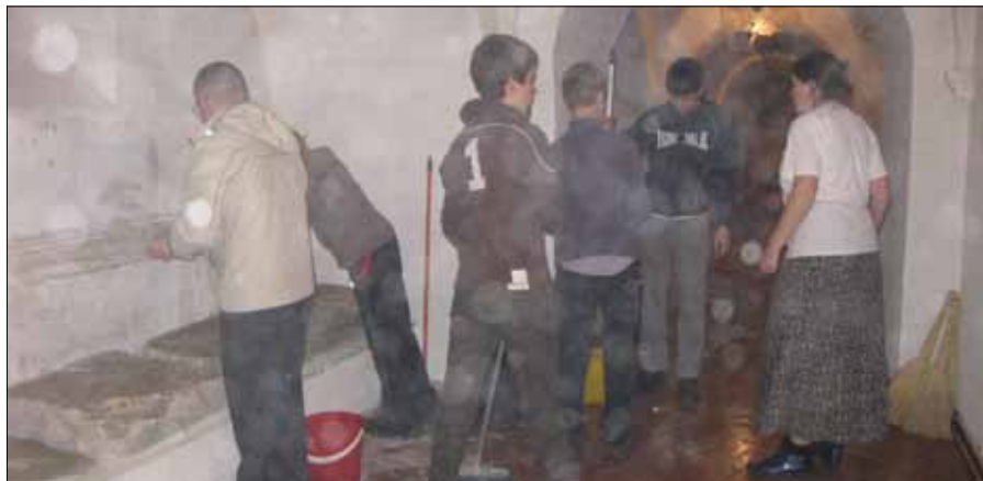
8 класс под собором.

В своем обращении к народу патриарх Кирилл сказал: «Сегодня исторический день для города Москвы, да и для всей России».